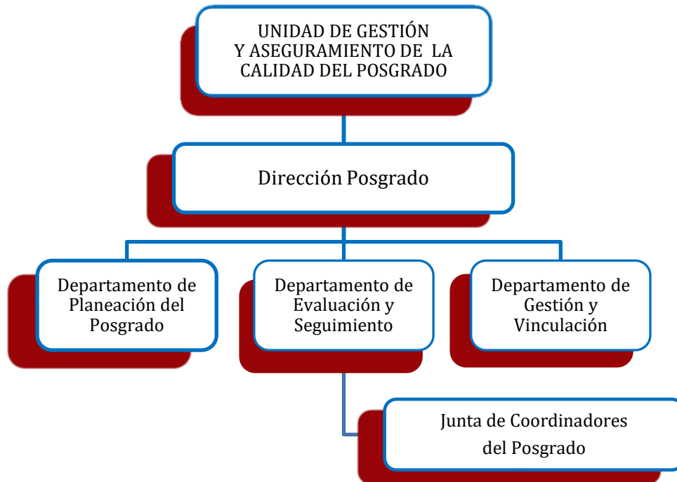
FIGURA 3. UNIDAD DE GESTIÓN Y ASEGURAMIENTO DE LA CALIDAD DEL POSGRADO.

tiempo de los logros obtenidos. Esta Unidad estará en comunicación directa con la Comisión Institucional a fin de tomar las decisiones que posibiliten la conservación y mejora de los índices de calidad de los posgrados de la universidad.