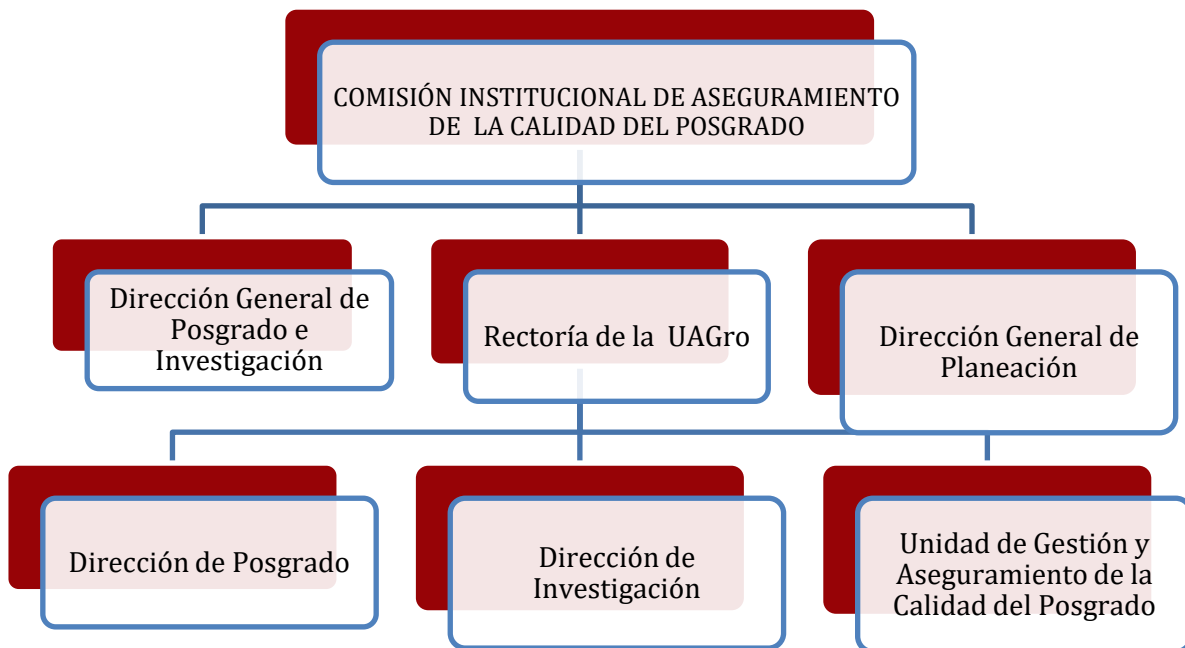
FIGURA 2. INSTANCIAS DEL SISTEMA DE ASEGURAMIENTO DE LA CALIDAD